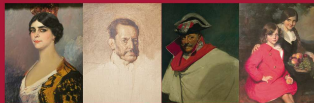
Pastora Imperio (1913) · El General Weyler (1915) · General Carlos Lñigo (1915) · Conchin y Tati (1909).