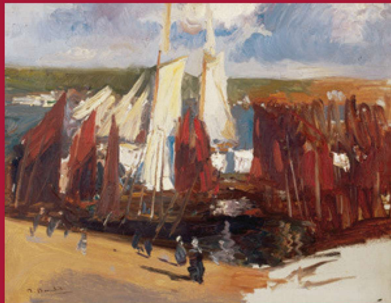
COLECCIÓN DE PINTURA