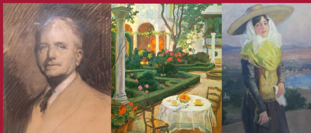
Autorretrato, 1941 · Primavera en el jardín (1938) y Joven Payesa Ibicenca (1915).