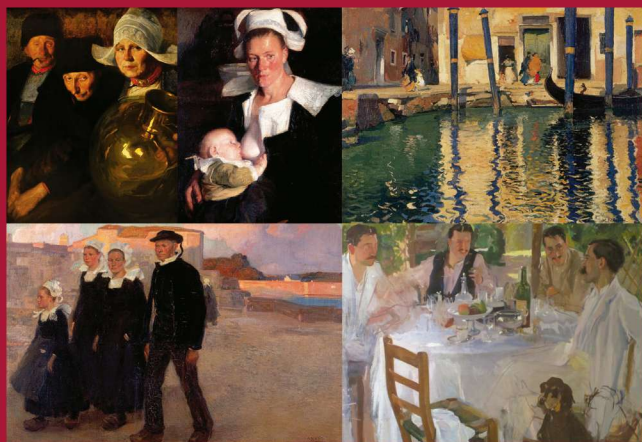
Viejos Holandeses (1909) · Madre Bretona (1905) · La familia bretona (1906) · Calle de Venecia (1901) · Sobremesa en el jardín de la Academia (1902).