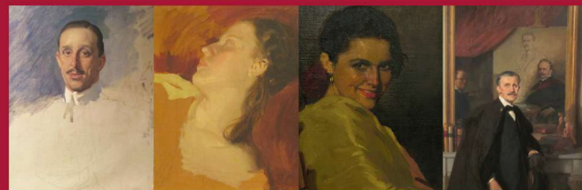
El rey Alfonso XIII (1928) · Reposo (1930) · Nelly (1939) · Hermanos Álvarez Quintero (1938).