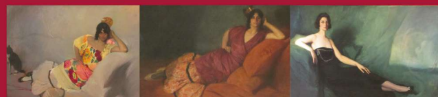
Gitana (1909) · La Gavilana (1910) · Genoveva Vix (1918)

Siempre tuvo predilección por el retrato, de ahí la diversa condición de los personajes retratados que van desde escenas familiares y modelos, a tipos costumbristas y personajes relevantes de la sociedad de su tiempo, tal y como se pueden contemplar en las diferentes salas.