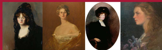
La Duquesa de Dúrcal (1910) · Isabel de Moncada (1917) · La Señora de Salinas (1909) · Muchacha de los lirios (1910).